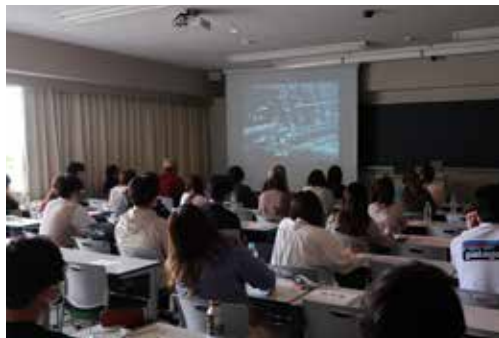
配信番組を活用した授業