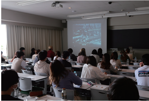
配信番組を活用した授業